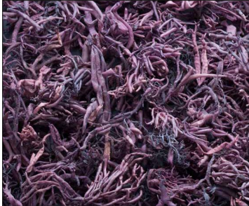
Le funori récolté