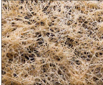
Le funori blanchi au soleil